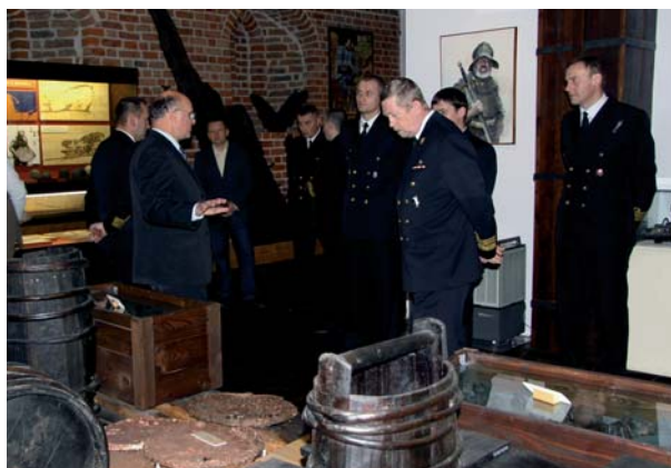
Na wystawie stałej w Spichlerzach na Ołowiance, 20.11.2009