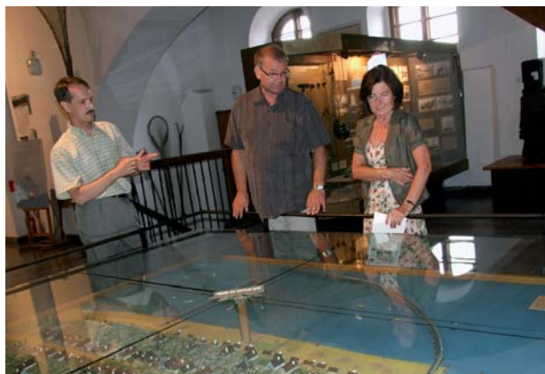
Muzeum Rybołówstwa w Helu, 6.08.2009