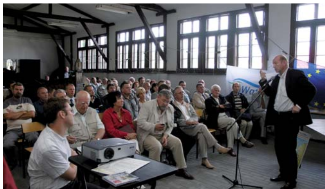
Konferencja w Muzeum Zalewu Wiślanego, 5.08.2006