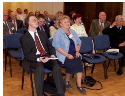
Otwarcie IX Konferencji Polskiego Muzealnictwa Morskiego i Riecznego, sala konferencyjna CMM (29.05.2008)

Pan TOMASZ MERTA jako Podsekretarz Stanu w Ministerstwie Kultury i Dziedzictwa Narodowego i Generalny Konserwator Zabytków, był w sposób szczególny zaangażowany w ochronę polskiego dziedzictwa kulturowego, w tym także morskiego. Wielokrotnie przybywał do CMM z wizytami roboczymi, zaznajamiając się z aktualną sytuacją instytucji. Aktywnie wspierał rozwój naszego Muzeum, interesując się zwłaszcza postęпами w realizacji inwestycji Ośrodka Kultury Morskiej.