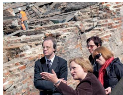
Badania archeologiczne przed budową Ośrodka Kultury Morskiej (20.06.2009)