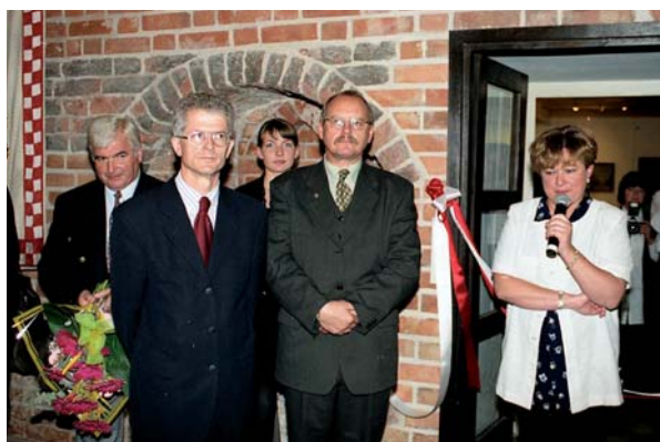
Na otwarciu wystawy „Lech Bądkowski. Twarzą do przyszłości”, 2.09.2000