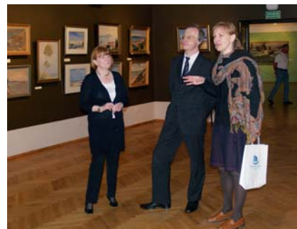
Na ekspozycji „Na spotkanie morza. Koło Marynistów Polskich w okresie międzywo- jennym” (20.06.2009)