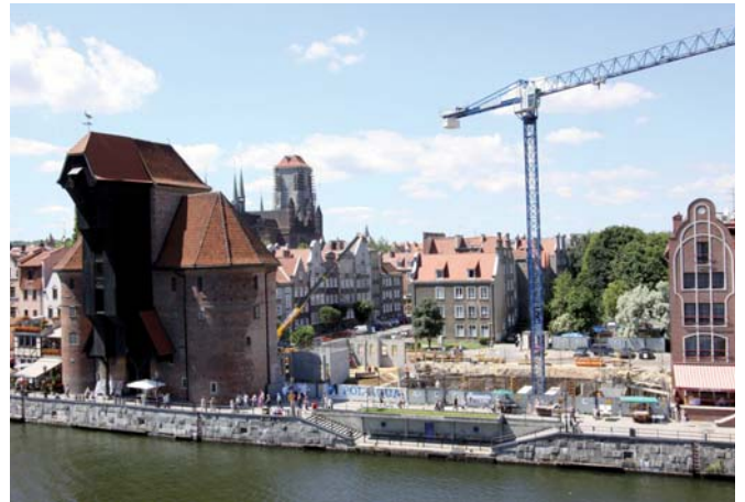
Stan prac przy wznoszeniu OKM na koniec czerwca.

Najbardziej widoczną zmianą na budowie Ośrodka Kultury Morskiej przy gdańskim Żurawiu jest wprowadzenie żurawia wieżowego, jednak zakres wykonanych w czerwcu prac jest znacznie szerszy. Zakończono już budowę fundamentów, stawiane też są ściany żelbetowe w niepodpiwniczonej części budynku.