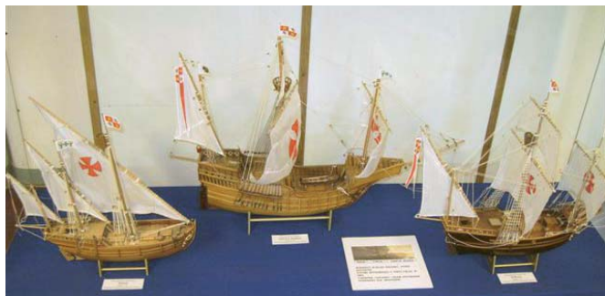
Modele statków Krzysztofa Kolumba na wystawie na „Darze Pomorza”.